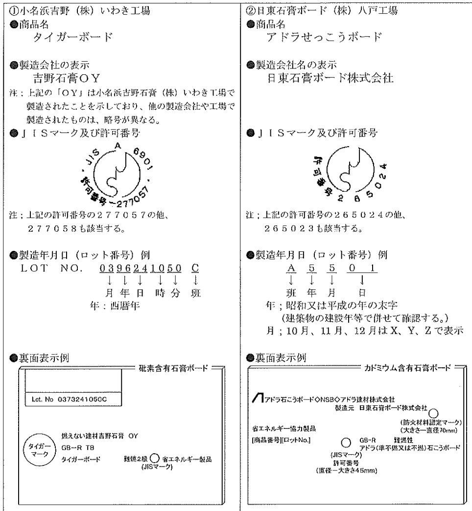
表5-5-2 ひ素及びカドミウム含有石膏ボードの裏面表示の詳細